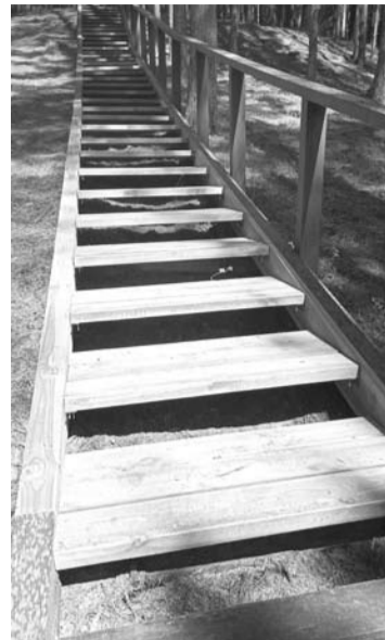
O taip tie patys laiptai atrodo po sutvarkymo.