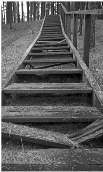
Tokie laiptai iki remonto vedė į Palatavio piliakalnį.

Iki remonto laiptai buvo išlūžinėję, supuvę, jais lipti buvo nesaugu, tad į piliakalnį šalia laiptų nusidriekė lankytojų išminti takeliai. „Anykšta“ apie piliakalnio būklę, kokia ji buvo pernai metų pabaigoje, yra rašiusi.