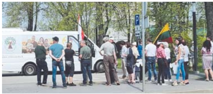
Agitacinis autobusas sustojo Anykščiuose, A.Baranausko aikštėje.

Jie sako NE: Stambulo konvencijai; partnerystės įstaty-