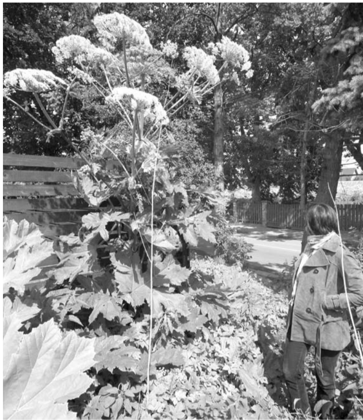
Didžiausia Sosnovskio barščių populiacija pastebėta Svėdasų seniūnijoje.

- Kaip savivaldybė elgiasi, kai Sosnovskio barščiai auga privačiuose žemės sklypuose? Ar yra taikomos