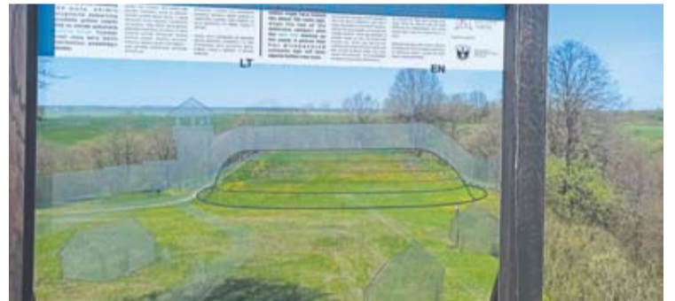
Bakainių piliakalnis. Genialu tai, kas paprasta: suvedi linijas - ir matai pilį.